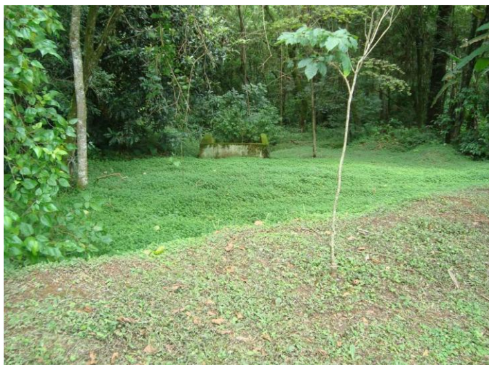
Figura 2 - canal na extremidade da rede e ponto de lançamento da rede sob o maciço arbóreo