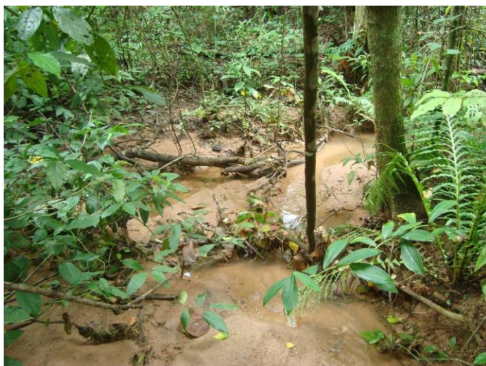
Figura 6 - canal de baixa declividade criado pelo processo erosivo, como resultado da estabilização natural acompanhado do assoreamento

Por se tratar de lançamento de rede de água pluvial e não de curso d'água, procurou-se adotar um tipo de estrutura padronizada, já de uso comum e consagrado para essa finalidade, com o intuito de facilitar ao residencial o processo de orçamento da obra e de implantação.