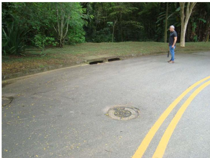
Figura 1 - curva da Rua Perúgia, final da rede de drenagem, com PV e boca de lobo

O ponto de lançamento consiste em canal de alvenaria com 5,6m de extensão e 1,9m de largura cuja extremidade não atinge a margem do córrego, estando a 20m de distância. Nesse trecho, a vazão era lançada sobre o solo na encosta do terreno, percorrendo esse trecho até atingir o curso d'água, sem revestimento, o que resultou em processo erosivo devido à velocidade tanto da chegada quanto do escoamento em superfície, e devido à falta de dissipador de energia, criou-se uma concha de erosão em todo o trecho, com taludes a prumo e instáveis.