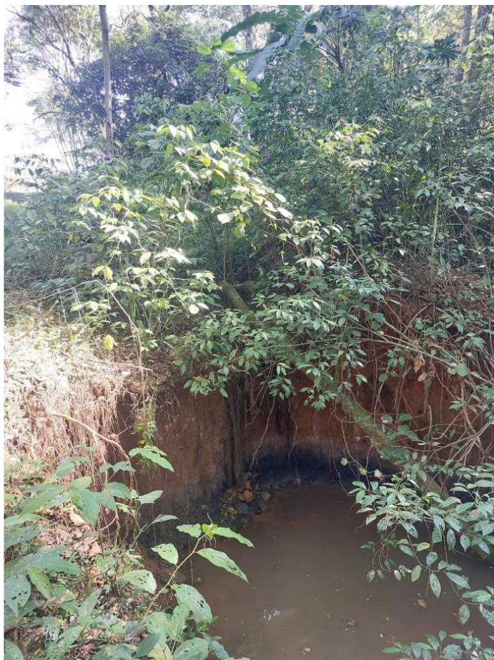
Figura 5 - degrau criado pela erosão com solapamento da base, criando desnível de 3,5m a ser vencido pelo dispositivo de dissipação. Na base do talude observa-se solo de coloração mais escura, que corresponde à rocha em processo de intemperização.