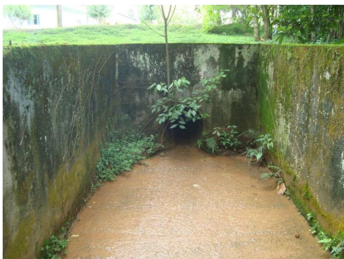
Figura 3 - rede chegando junto à parede do canal